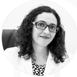
Dra. Inés Fernández Canedo Hospital Costa del Sol Marbella, Málaga.