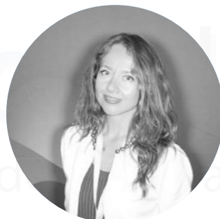
Dra. Olga Rusinovich Hospital Universitario Puerta de Hierro, Majadahonda, Madrid