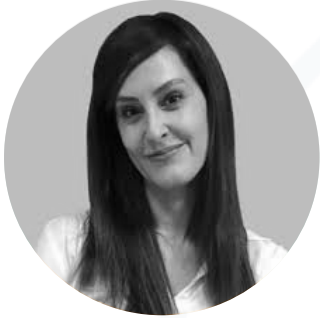
Dra. Priscila Giavedoni Hospital Clínico, Barcelona